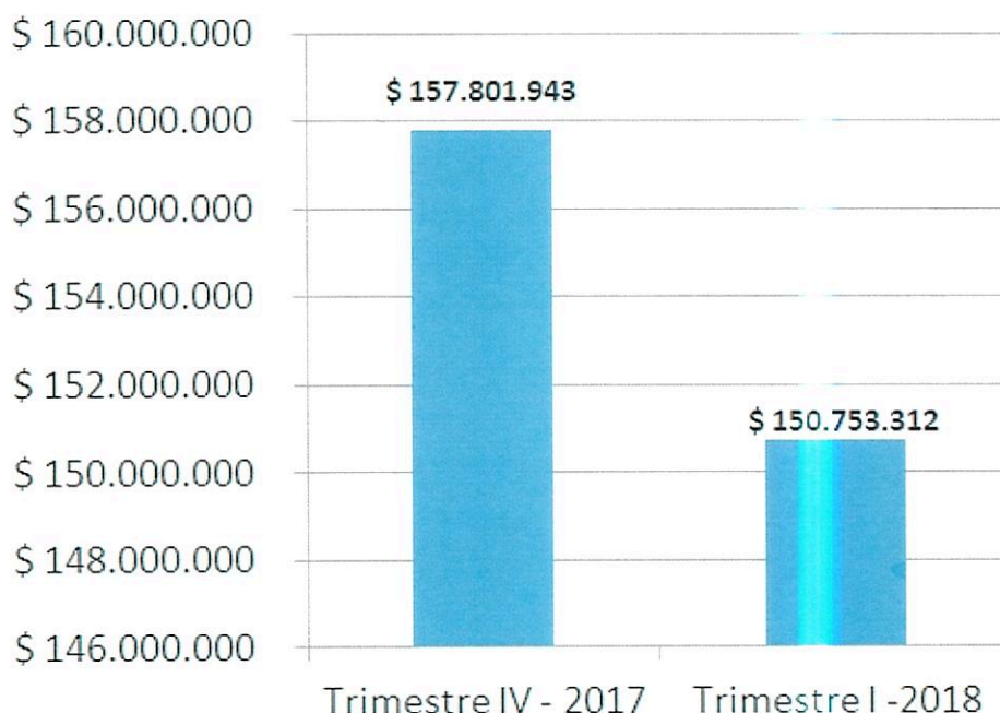
Gráfica 2: Servicios Públicos – Telecomunicaciones comparativo trimestral